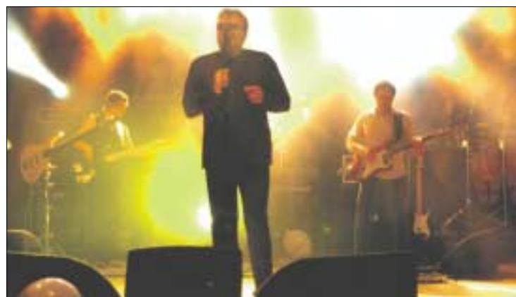
Budka Suflera wykona dziś w Opolu zupełnie nową piosenkę